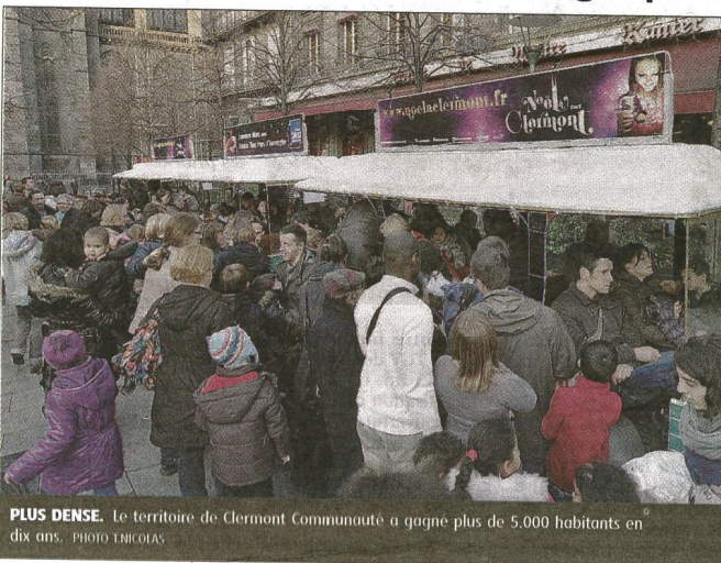
PLUS DENSE. Le territoire de Clermont Communauté a gagné plus de 5.000 habitants en dix ans.

Ce couloir, où la densité est la plus forte (100 à plus