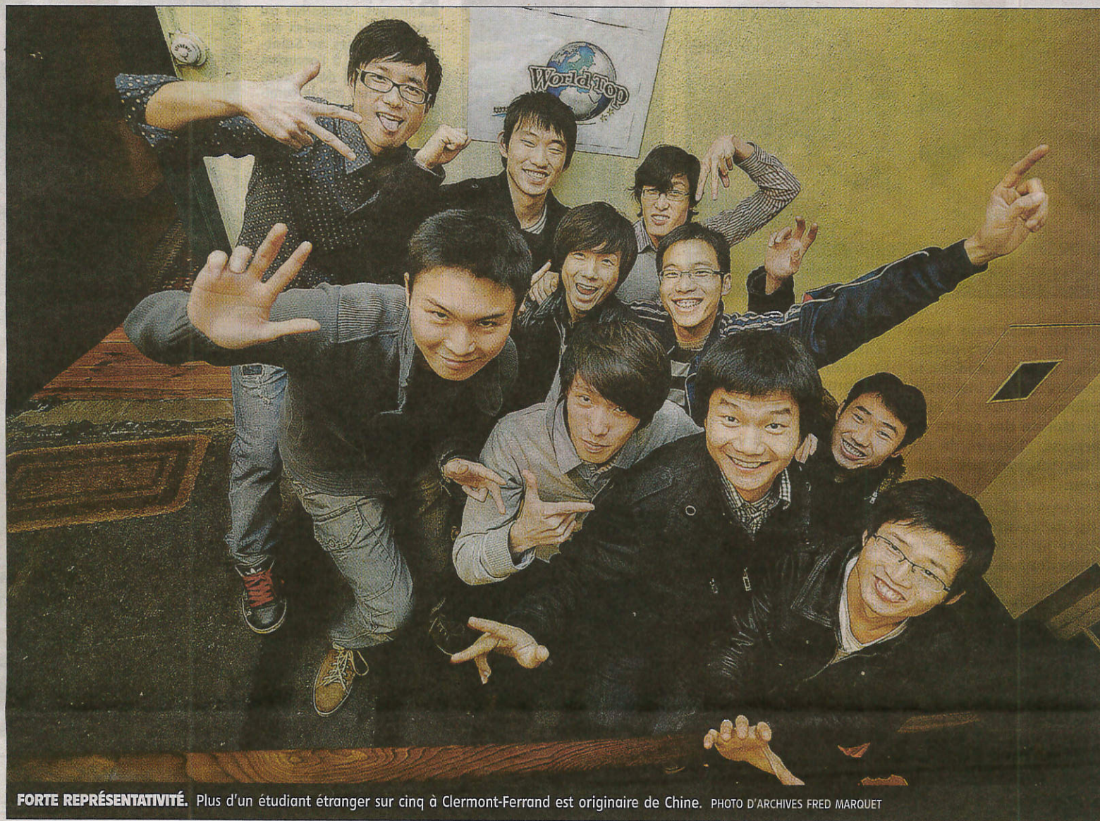
FORTE REPRÉSENTATIVITÉ. Plus d'un étudiant étranger sur cinq à Clermont-Ferrand est originaire de Chine.

Pour Blaise-Pascal, on compte deux cents étudiants étrangers dans le cadre d'Erasmus, une centaine dans le cadre de conventions bilatérales entre pays, 400 inscrits au Service universitaire des étudiants étrangers pour l'apprentissage du français avant d'intégrer une formation